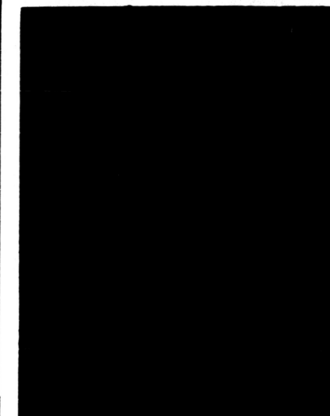
Volleyball dalam Nationale Olympiade di Tokyo.